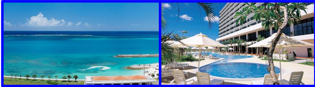
<ホテル外観イメージ>

日程 2024年7月5日 [金] ~ 7月7日 [日] (3日間) 場所 サザンビーチホテル&リゾート沖縄 〒901-0306 沖縄県糸満市西崎町1-6-1 対象 臨床研修医 (後期含む) / 指導医 / 一般臨床医 定員 120名 費用 66,000円(税込/懇親会費含む) ※交通費、宿泊費等は含まれておりません。 主催 臨床研修プログラム研究会/株式会社エスミ