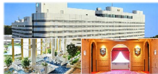
<ホテル外・内観イメージ>