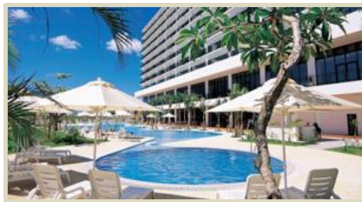
<ホテル外観イメージ>

日程 2025年 7月 4日 [金] ~ 7月 6日 [日] (3日間) 場所 サザンビーチホテル&リゾート沖縄 〒901-0306 沖縄県糸満市西崎町1-6-1 対象 臨床研修医(後期含む) / 指導医 / 一般臨床医 定員 120名 費用 66,000円(税込/懇親会費含む) ※交通費、宿泊費等は含まれておりません。 主催 臨床研修プログラム研究会 / 株式会社エスミ