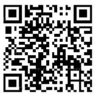
【ERアップデートお申込】